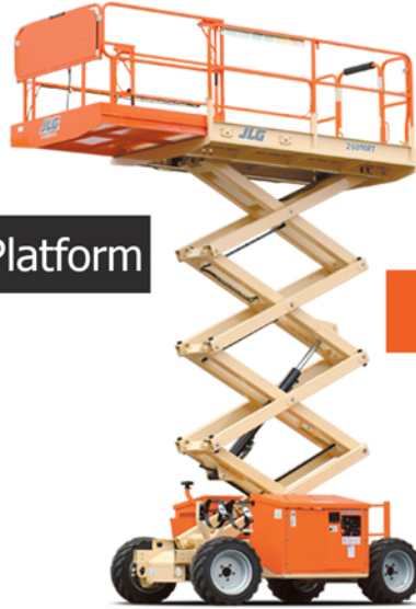
Diagram ve Ölçüler